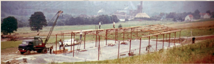
Baubeginn 1971 in Brumlingsen, im Hintergrund die alte Zellstofffabrik in Wildshausen