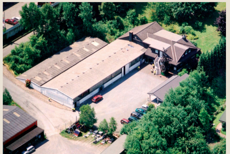
Der Firmensitz in Freienohl, Gewerbegebiet Brumlingsen

Beim Werksverkauf stehen besonders die intensive und persönliche Beratung durch die gesamte Familie im Mittelpunkt. Es werden anspruchsvolle Produkte zu Top-Preisen angeboten. Ein Geheimtipp, den nicht nur Sauerländer Kunden wahrnehmen.