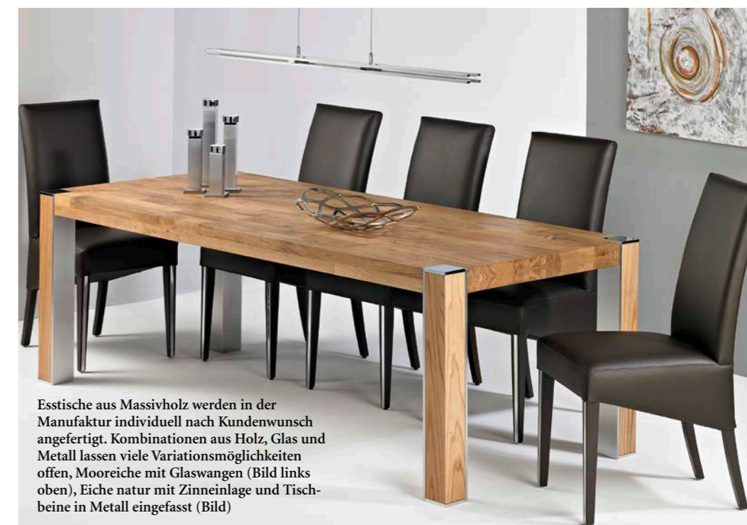
Esstische aus Massivholz werden in der Manufaktur individuell nach Kundenwunsch angefertigt. Kombinationen aus Holz, Glas und Metall lassen viele Variationsmöglichkeiten offen, Mooreiche mit Glaswangen (Bild links oben), Eiche natur mit Zinneinlage und Tischbeine in Metall eingefasst (Bild)

das Familienunternehmen nachdrücklich auf den Wirtschaftsstandort zwischen Arnsberg und Meschede. „Made in Sauerland“ bedeutet: Hergestellt in der Region, aus bestem Material und ohne lange Transportwege! Nachhaltig und gleichzeitig innovativ, schnelle Lieferzeiten und Sonderpreise eingeschlossen. Dazu persönliche Beratung in gastlich-familiärer Atmosphäre: So wird der Besuch bei ROSE-HANDWERK zu einem Erlebniseinkauf der besonderen Art!