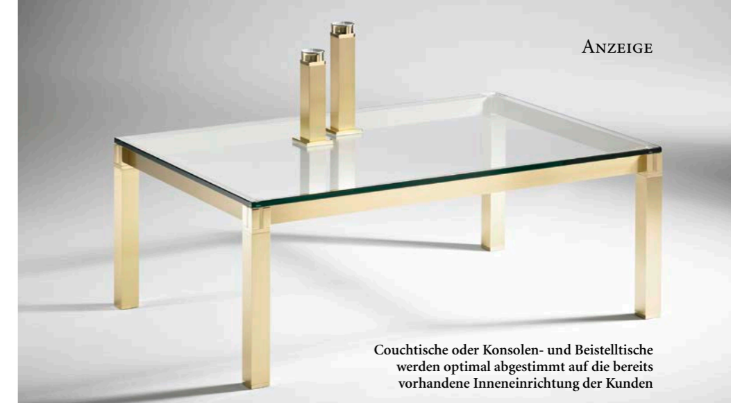
Couchtische oder Konsolen- und Beistelltische werden optimal abgestimmt auf die bereits vorhandene Inneneinrichtung der Kunden

dig, wo in den 1960er-Jahren sogar zwei Edgar-Wallace-Filme gedreht worden sind!